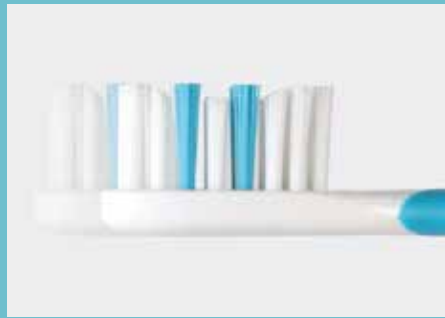
kurzer Bürstenkopf für ideale Erreichbarkeit aller Zähne