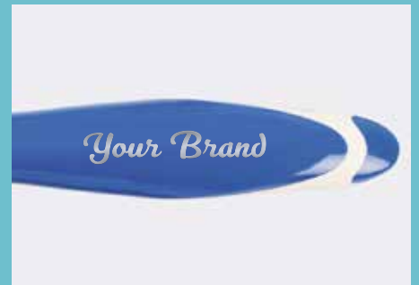
Bereich für individuelle Prägung am Griffende