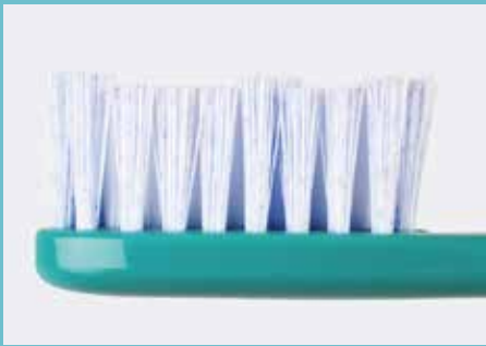
spezielle Micro-Granulat Borsten für Whitening-Effekt