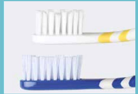
beide Stufenprofile sorgen für eine optimale Reinigung