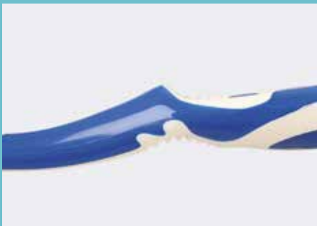
sichere Führung dank angenehmer Lamellen im Daumenbereich